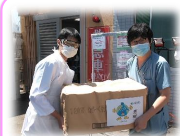
埼玉 ふじみの救急クリニック様

埼玉地区において、コロナ診療を積極的に対応しており、報道でも度々取り上げられている「ふじみの救急クリニック」様へトイレットペーパーを寄贈いたしました。