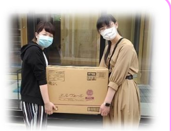
福島県 郡山 菊池医院様